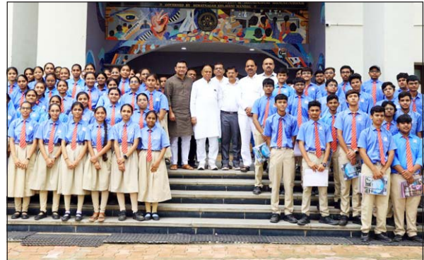
હિંમતનગર એપીએમસી ફાર્મસી કોલેજમાં "ફામાં યાત્રા"નું આયોજન કરવામાં આવ્યું હતું. હિંમતનગરની શાળાના ધોરણ ૧૧ અને ૧૨ના વિદ્યાર્થીઓને ફાર્મસીનું પ્રેક્ટિકલ જ્ઞાન મળી રહે તેમજ આવનાર સમયમાં તેઓ યોગ્ય કારકિર્દી પસંદ કરી શકે તે હેતુથી કોલેજની મુલાકાત કરાવવામાં આવી. આ પ્રસંગે ધારાસભ્ય વી. ડી. ઝાલજી વગેરે હાજર રહ્યા હતા.

મોડાસા, તા.૪ અરવલ્લી જિલ્લા અને સાબરકાંઠા જિલ્લામાં દશામાંના ૧૦ દિવસનું વ્રત પૂર્ણ થયું છે. ભક્તોએ માતાજીની મૂર્તિનું વાજતે-ગાજતે વહેતા પાણીમાં વિસર્જન કર્યું હતું. આમ ભક્તોએ શ્રદ્ધા અને આસ્થાભરે દશામાં માતાજીની મૂર્તિના વળામણ કર્યા હતા. દિવાસના દિવસે ભક્તોએ દશામાની મૂર્તિ ખરીદીને વાજતે-ગાજતે ગૃહ પ્રવેશ કરાવી સ્થાપન કર્યું હતું. બંને જિલ્લામાં નદી કિનારે અને તળાવ કિનારે વહેલી સવારથી શ્રદ્ધાળુઓની ભીડ ઉમટી પડી હતી. સવારે અને સાંજે દશામા આરાધના કરવામાં આવી હતી. દશામા માતાજીના મંદિરે ગરબાના આયોજન કરવામાં આવ્યું હતું. જ્યાં ભક્તો ગરબે ધૂમ્પા હતા. સાબરકાંઠા જિલ્લામાં વિજયનગર તાલુકામાં દશામાં મૂર્તિની સ્થાપના કર્યાના ૧૦ દિવસ સુધી પૂજા-અર્ચના અને આરતી બાદ ગત રાત્રે વ્રતના જાગરણ બાદ શોભાયાત્રા યોજાઈ હતી. જિલ્લાના વિજયનગર, ખેડબ્રહ્મા, પોશીના અને પ્રાંતિજમાં દશામાંની મૂર્તિનું નદીમાં વિસર્જન કરાયું હતું.