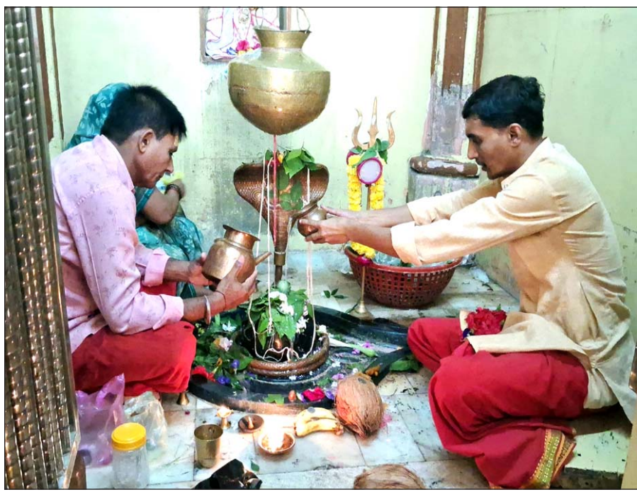
નીલકંઠ મહાદેવ મંદિરે શ્રદ્ધાળુઓએ દૂધ અને જળનો અભિષેક કર્યો હતો.